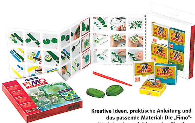
Kreative Ideen, praktische Anleitung und das passende Material: Die „Fimo“-Workshopbox erleichtert den Einstieg.