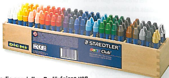
Für die speziellen Bedürfnisse von Kindergartengruppen und Schulklassen hat Staedtler Holzboxen für Wachsmalkreiden und Vorratsflaschen für Fingermalfarben entwickelt.