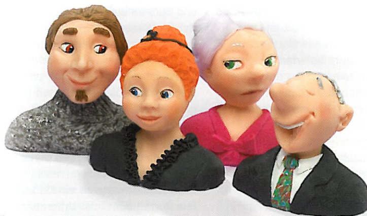
Die Anfänge gehen auf die bekannte Puppenmacherin Käthe Kruse im Jahre 1939 zurück.

Der Ursprung geht zurück auf das Jahr 1939. Die berühmte Puppenmacherin Käthe Kruse suchte nach einem neuen Material für ihre Puppenköpfe und experimentierte mit einem gerade neu entdeckten Stoff. Nachdem sich das Material für die Serienproduktion nicht eignete, nahm es sich die Tochter Sophie vor, arbeitete Pasten und bunte